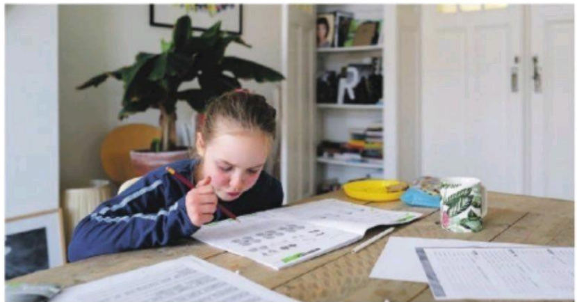
Een leerling van 8 jaar krijgt thuisonderwijs.